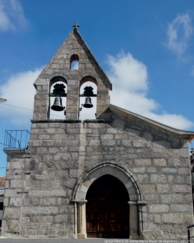
Igreja Matriz de Santa Maria Maior de Algodres - séc. XVII