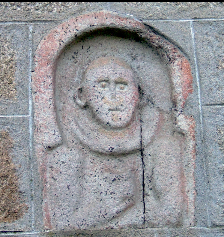
Busto do Algodres - Escultura em Baixo Relevo

A Rota dos Miradouros desenvolve-se dentro da Freguesia de Algodres, uma das Aldeias de Montanha do Concelho de Fornos de Algodres. A aldeia de Algodres está implementada a 700 metros de altitude é “dona” de uma das melhores vistas sobre o Vale do Mondego e mantém ainda muito daquilo que é a vida rural no interior. Explore este percurso percorrendo esta aldeia-freguesia que chegou a ser vila e sede de concelho até ao início do século XIX, deambule entre as suas ruas estreitas e por quelhas esquecidas, observe monumentos de outros tempos como o Pelourinho do século XVI, as igrejas e capelas e os solares, deixe-se impressionar por uma paisagem fantástica sobre o vale da serra da estrela e disfrute da natureza e do ar puro que este percurso lhe oferece.