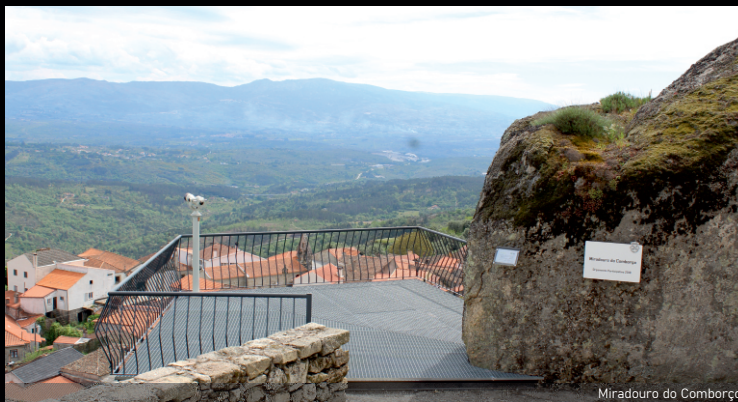
Miradouro do Comborço