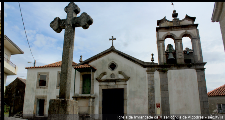
Igreja da Irmandade da Misericórdia de Algodres - séc. XVII